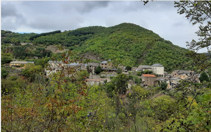
Village d'Ayssènes (Association AVA)