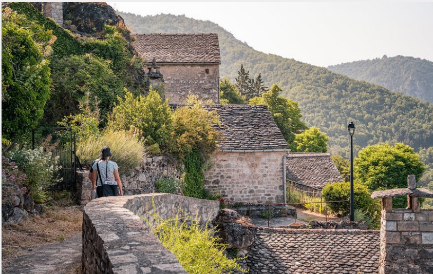
Saint-Véran Gorges de la Dourbie (EnzoPlanes)