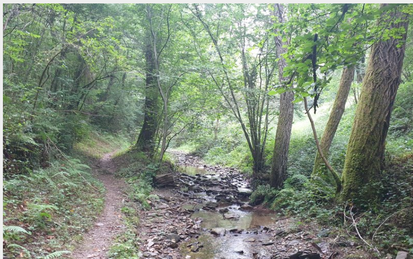
Sentier sous-bois ruisseau