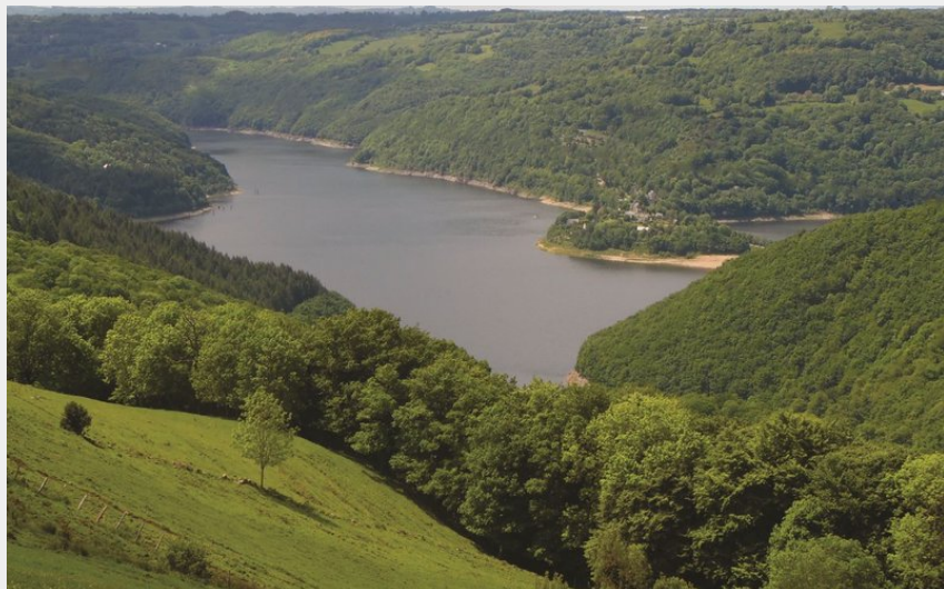
Vue sur la Presqu'île de Laussac depuis Vines