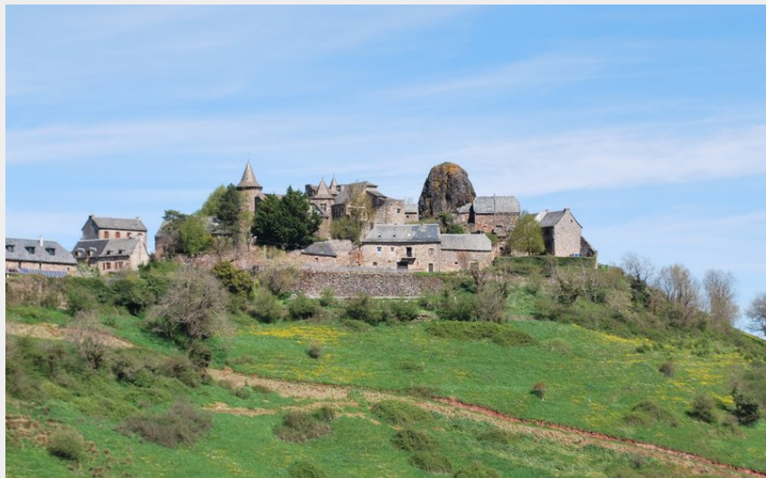
Le village de Roquelaure (3CLT ©)