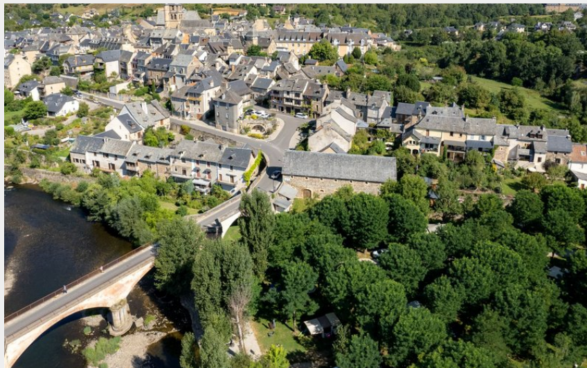
Le village de Saint-Côme-d'Olt