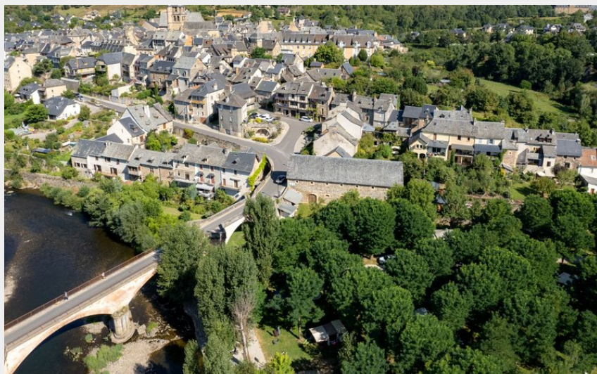
Le village de Saint-Côme-d'Olt