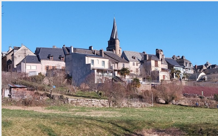
St-Côme-d'Olt depuis les jardins au bord du Lot