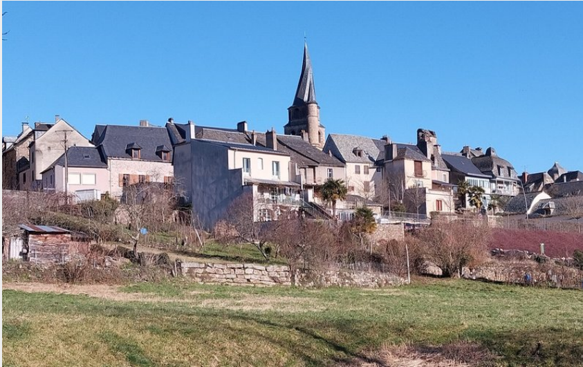
St-Côme-d'Olt depuis les jardins au bord du Lot