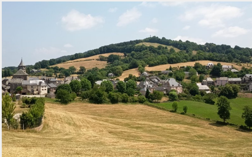
Point de vue sur le village de Lassouts