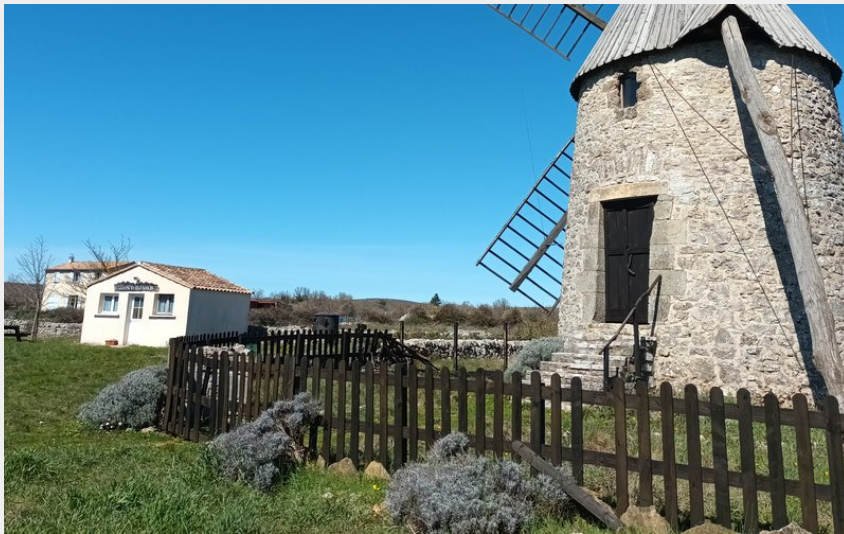
moulin de St Pierre de la Fage (AK - CCLL)