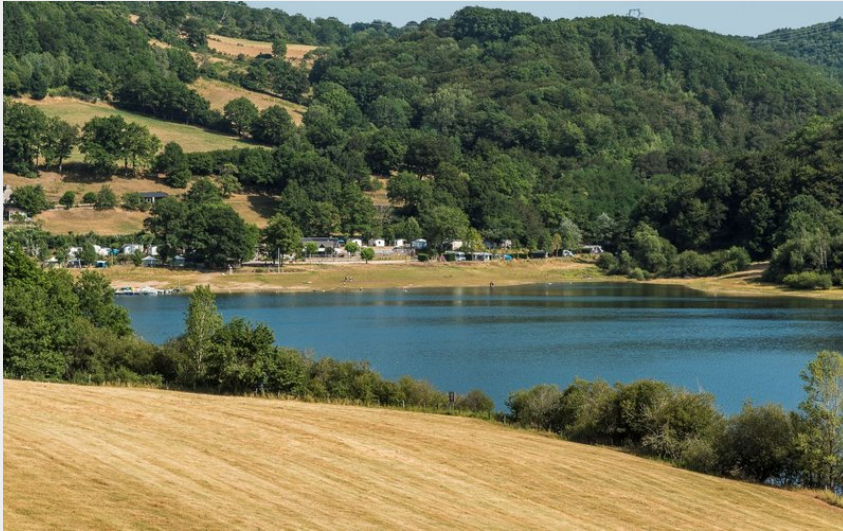
Lac de la Selves ou Maury