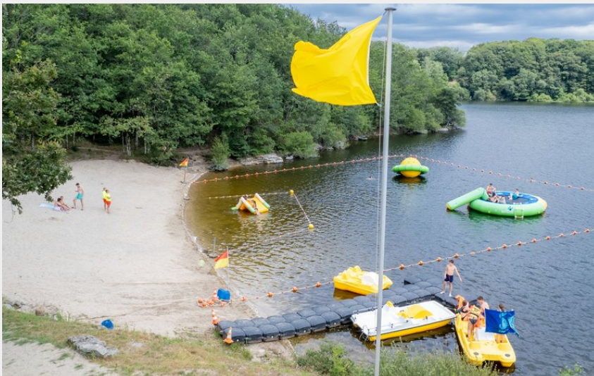
Baignade surveillée en été aux Galens