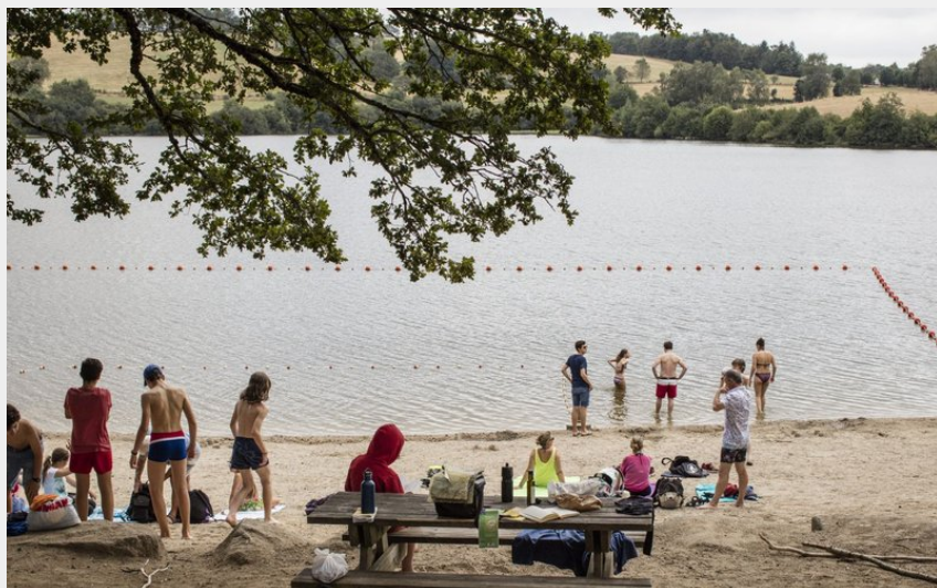
Baignade et pique nique au lac des Galens