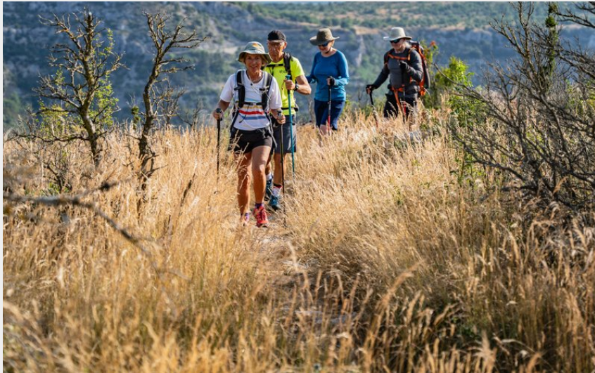
randonneurs sur le causse