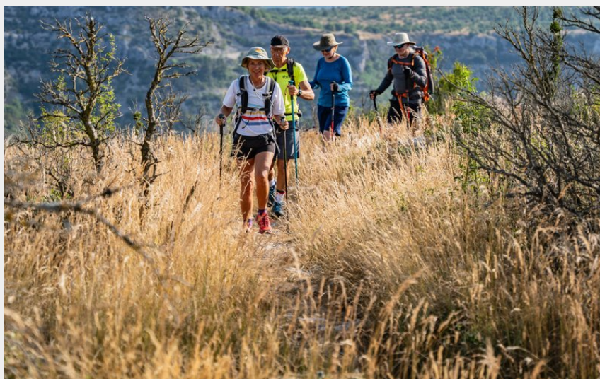
randonneurs sur le causse (Rodolphe Travel - Vitinova)