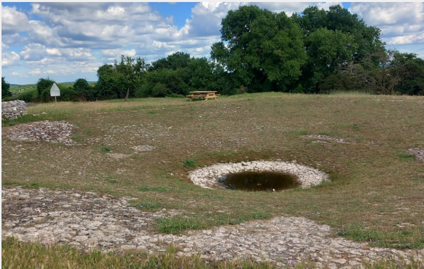
Lavogne