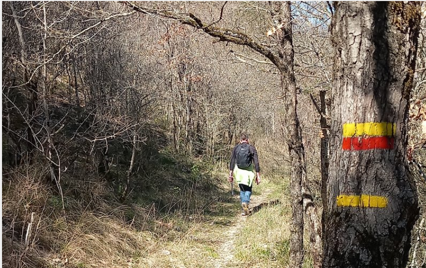
sentier Sorbs