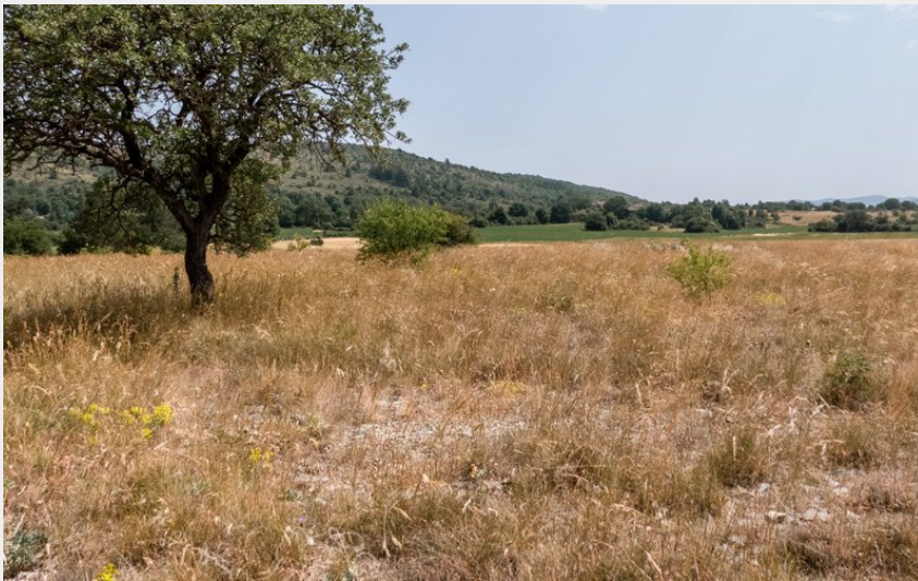
chêne sur le causse