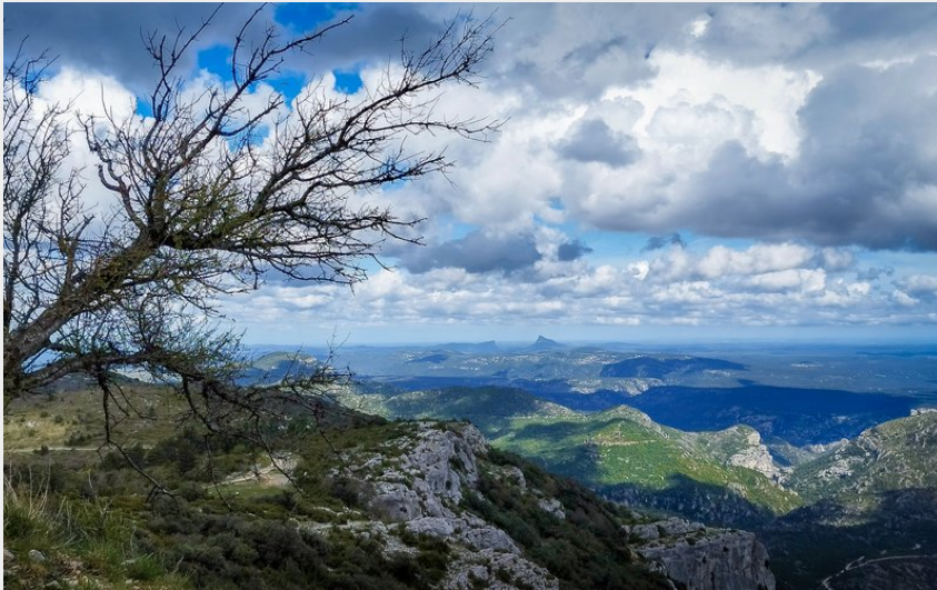
Panorama depuis Pic St Baudille