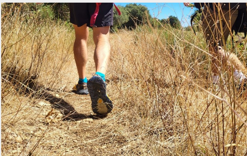
pas de randonneur (AK - CCLL)