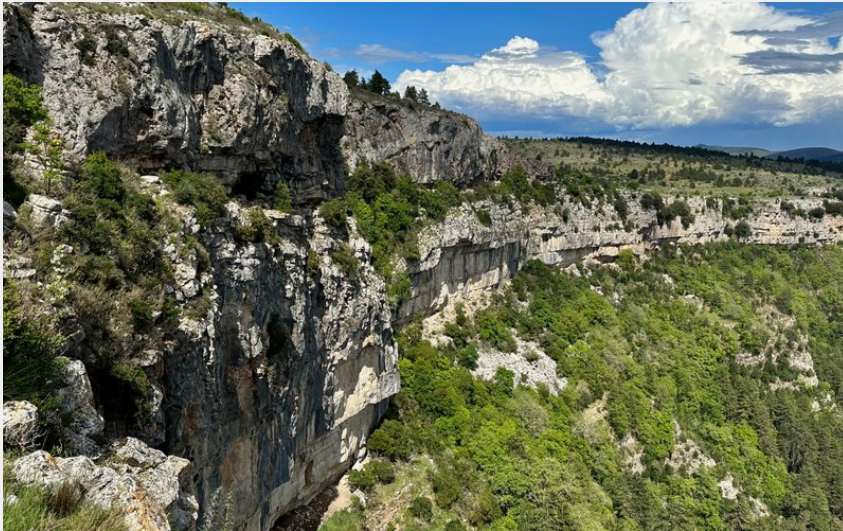
cirque du bout du monde