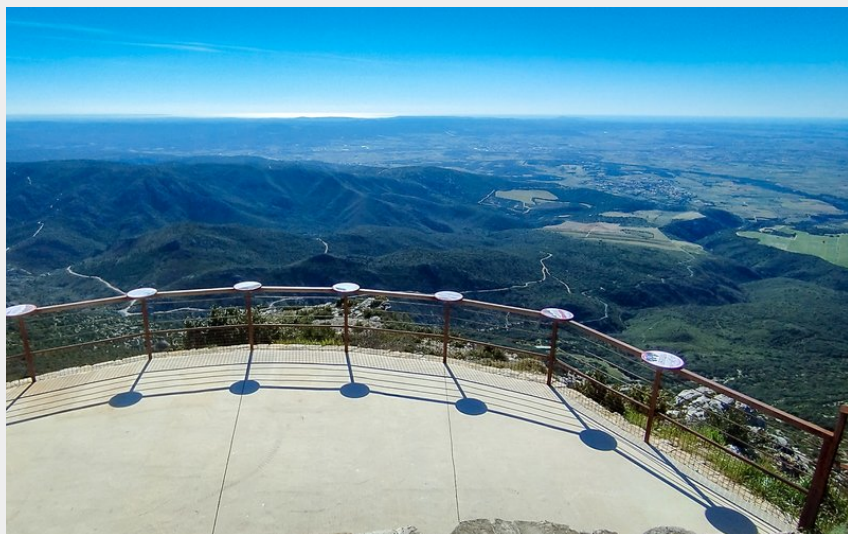
Panorama depuis Mont St Baudille