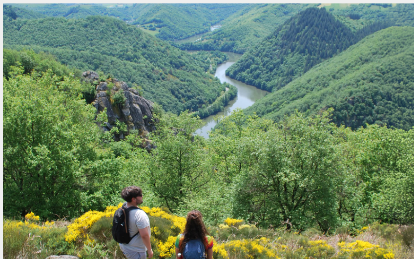
La vallée du Lot depuis le chemin des Légendes