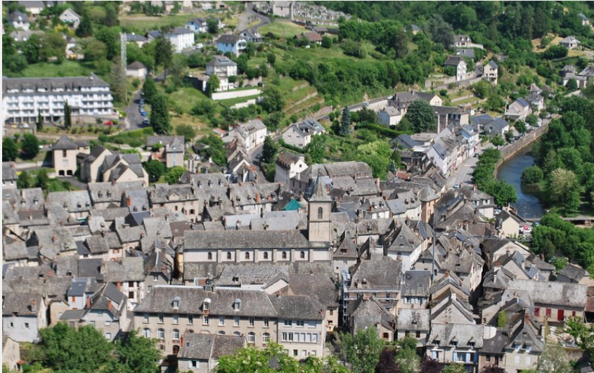
Point de vue sur le centre bourg d'Entraygues