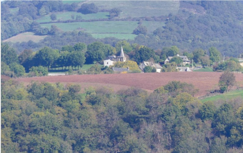
Le village d'Annat (3CLT©)