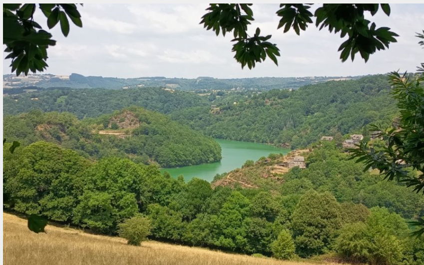
Le lac de Castelnau-Lassouts