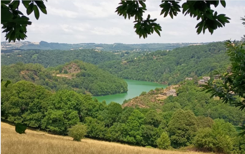
Le lac de Castelnau-Lassouts (3CLT©)