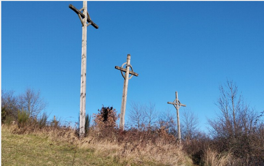
Les calvaires du Puech de Levade