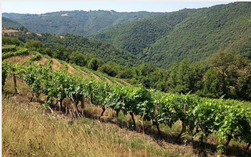
Les vignes à Méjanaserre