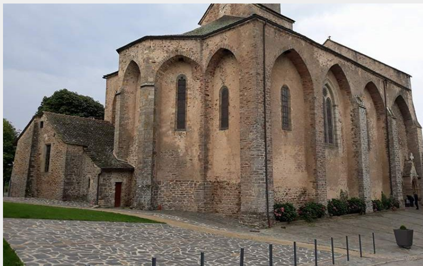
Eglise Saint Martial, Rieupeyroux