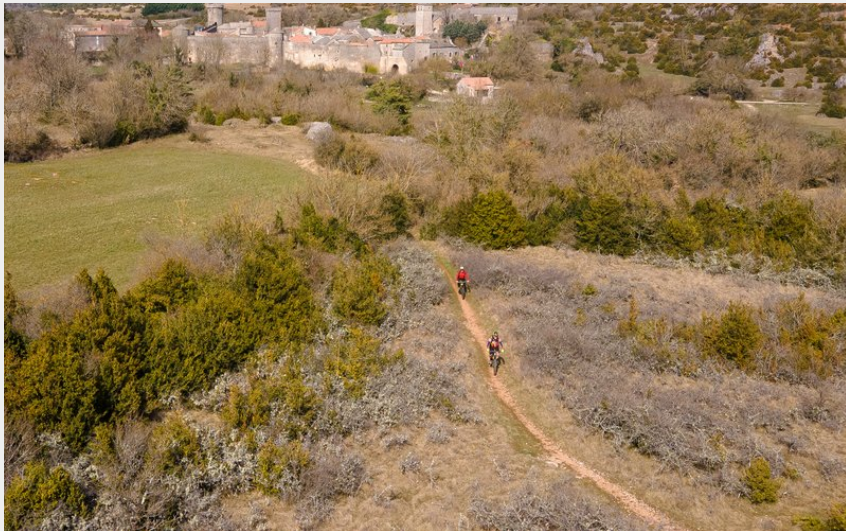
VTTiste - couvertoirade (Vincent Bartoli)