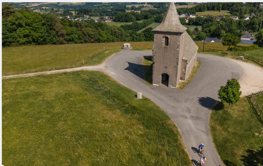
La Chapelle Saint-Jean de Rieupeyroux (Greg Alric)