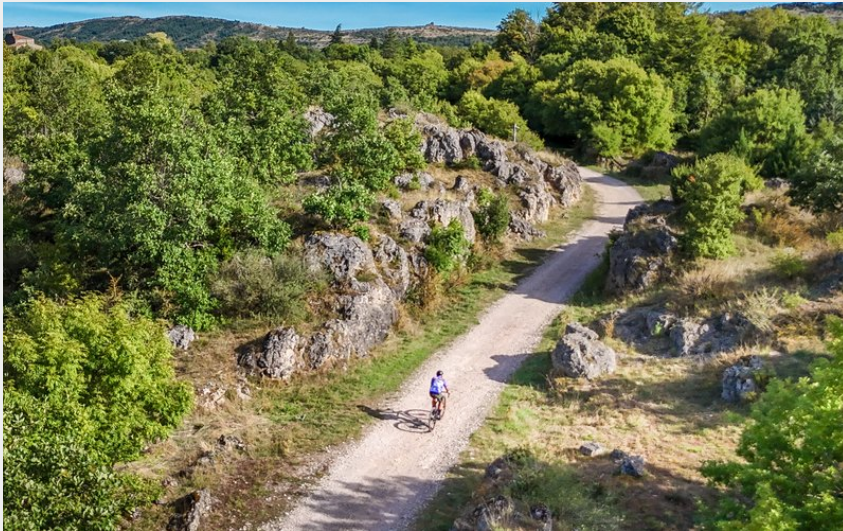
Cycliste gravel sur belle piste du larzac près du Cros (Eric Brendle)