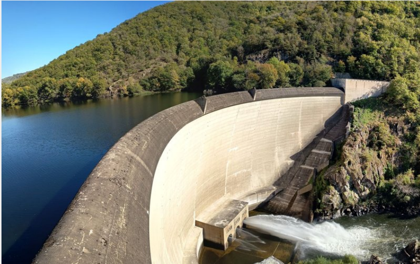
Le barrage de Couesques