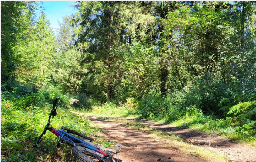
piste dans l'escandorgue (AK - CCLL)