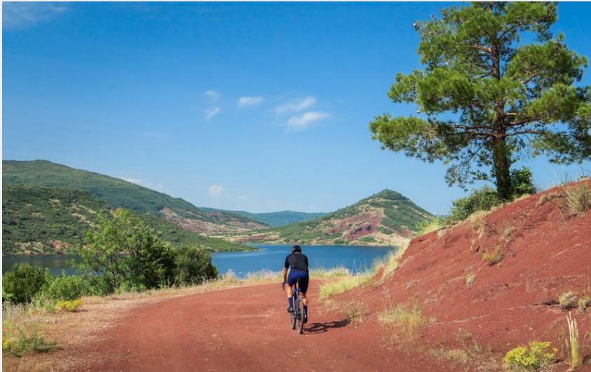
Cycliste sur une piste du Lac du Salagou (Eric Brendle)