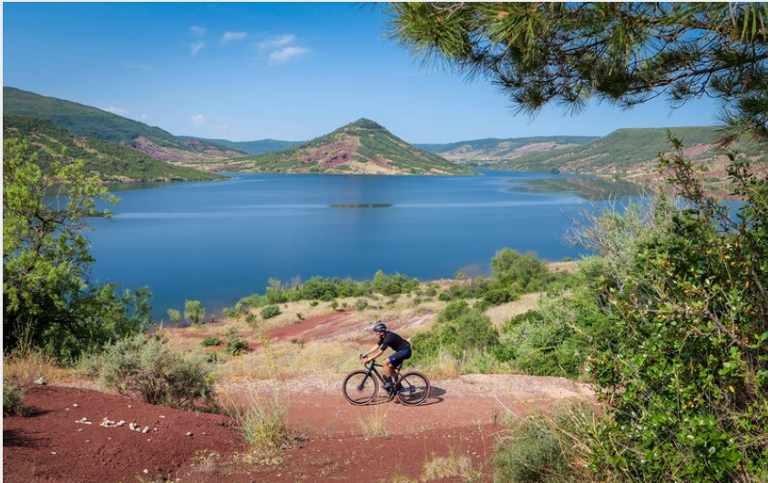
Carte postale Gravel du Lac du Salagou (Eric Brendle)