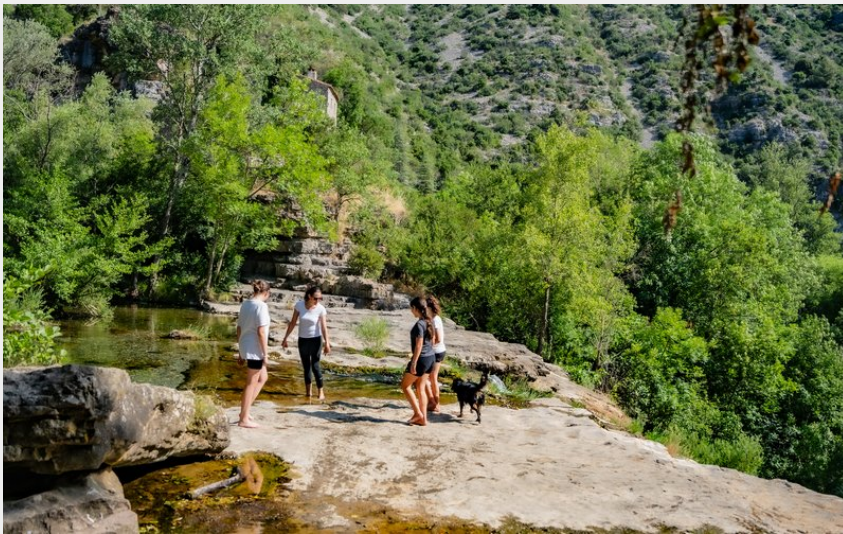
cascade Navacelles (Rodolphe Travel - Vitinova)