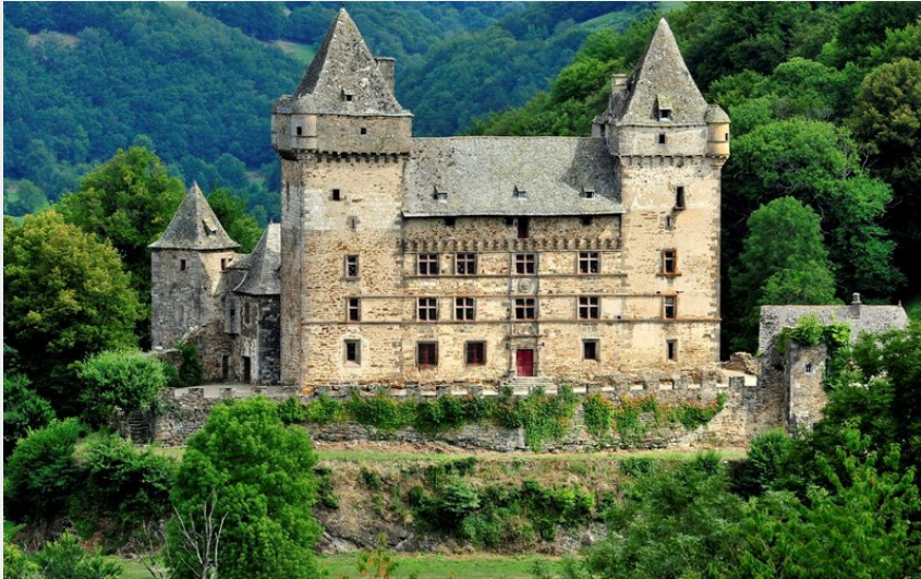
Messilhac émergant de la verdure