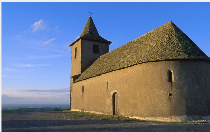
Chapelle de Rieupeyroux