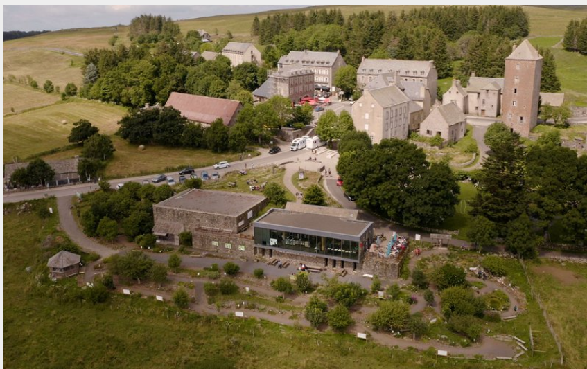
La Maison de l'Aubrac