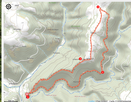
Le site clunisien de Manhaval, aux milieu des vallées boisées

Au départ du hameau de Manhaval, une randonnée à cent lieux de toute civilisation, propice au rêve, en remontant une vallée paradisiaque.