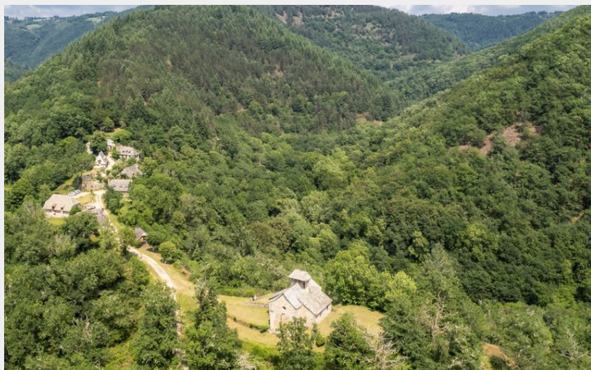
Le site clunisien de Manhaval, aux milieu des vallées boisées