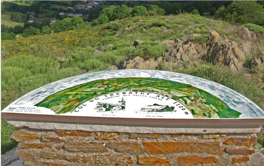
Table d'orientation au Col du Trébatut (OTAGDT)