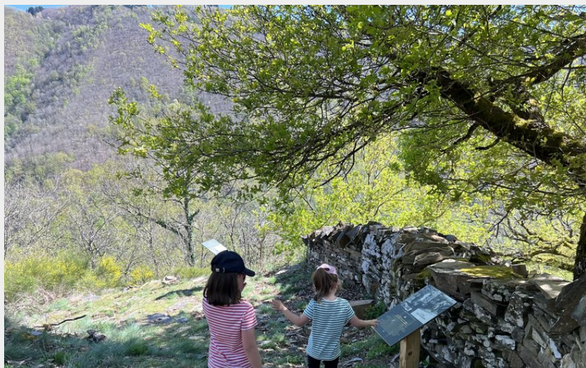
En cheminant le long des terrasses en pierres sèches