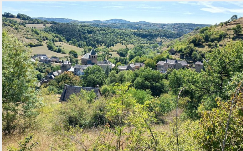
Point de vue sur le village de Coubisou