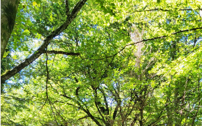
Forêt (AK - CCLL)