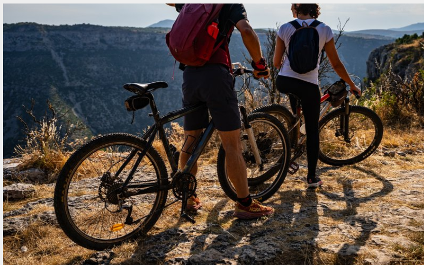
vttistes - Navacelles (Rodolphe Travel - Vitinova)