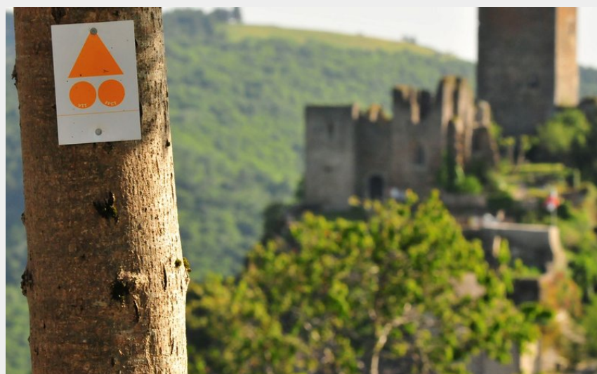
Dans la descente vers Valon